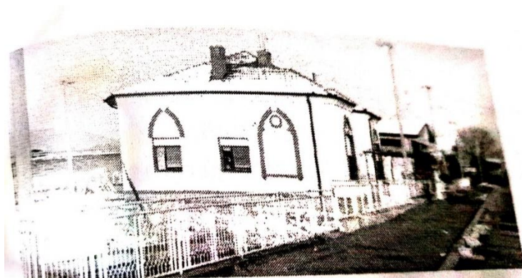
Dogana e vjetër në Davidoc

Si trashëgimi e kemi të njohur edhe Doganën e Vjetër në Davidoc i cili ishte objekt kufitar i vendosur në vitin 1878 pas Kongresit të Berlinit