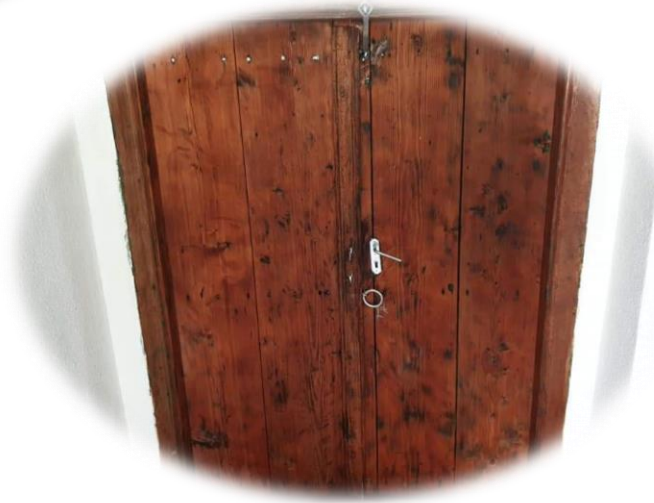
Fig. - 6 Xhamia ne Zarbinc e rindertuar ne vitin 1889