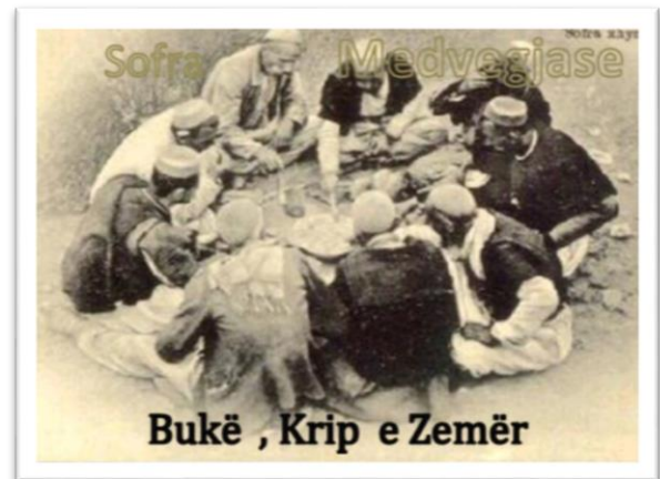
Fig. – 1 Foto te mikpritjes se kultures shqiptare