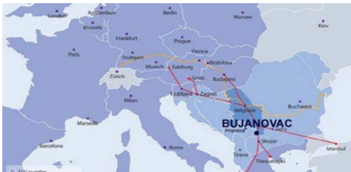
Fig. – 3 Rajoni i Bujanocit

Rajoni i Bujanocit zë një vend të rëndësishme gjeografike kufizohet me Vrajën, Dardanën, Gjilanin, Preshevën dhe Tërgovishtën. Nëpër Bujanoc kalojnë: Autorruga Beograd-Nish-Vrajë-Preshevë-Shkup-Selanik dhe hekurulla Beograd-Shkup-Selanik.