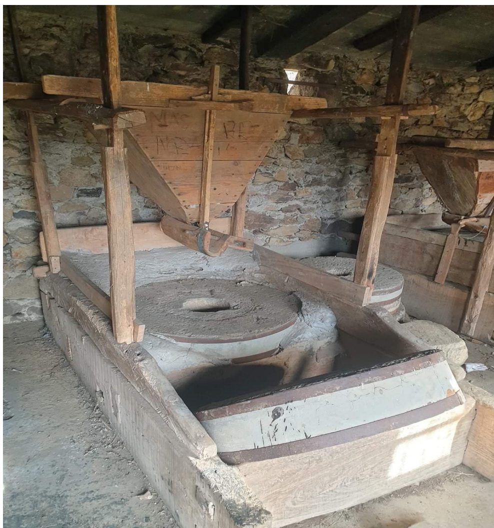
Fig. – 5 Foto nga Mulliri i fshatit ne Breznice te Eperme