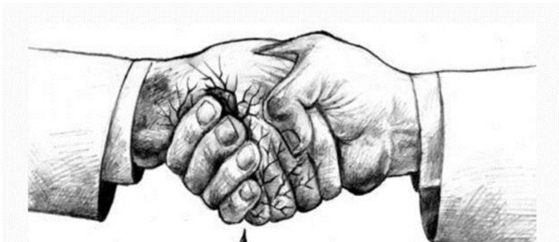
Fig. – 2 Shterngimi i duarve ne shenje bese