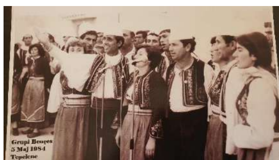
Grupi polifonik i Bënçës Tepelenë 5 maj 1984

Kënga qytetare e shoqëruar me instrumente popullore, një traditë e vonshme (mesi i viteve 50 shekulli kaluar) evoluoi koha bashkë me civilizimin e jetës, ku dasmat bëheshin vetëm me këngë labëe dhe vallen