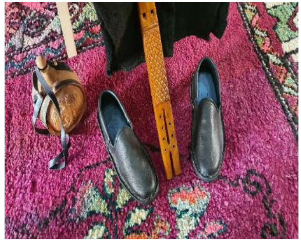
Fig. – 30 Opingat e bariut, cyla dyjare, paguri i

Cyla dyjare e krahinës së labërisë, Duzina me zile dhe këmborë të blektorisë, paguri i vjetër prej druri me të cilin pinte ujë bariu në stanin e tij.