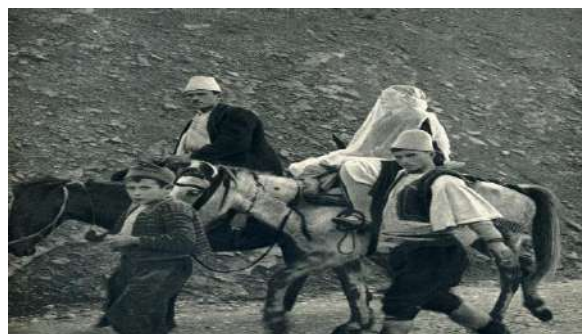
Rituali i dasmës marja e nuses me kal