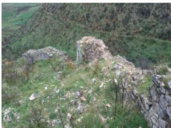
Fig. - 25 Kalaja e Zharrës Turan