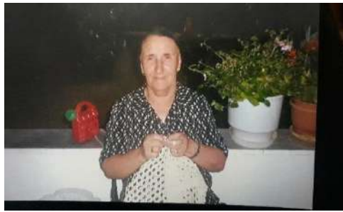
Fig. – 19 Punim dore në triko