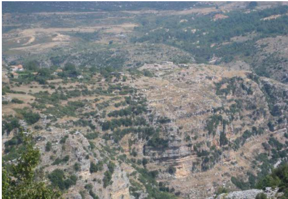
Fig. – 4 Kalaja e Nivicës Kurvelesh

Vendbanime të fortifikuara me mure masive në Zharrë, Horë, Rabie, Lekël etj.