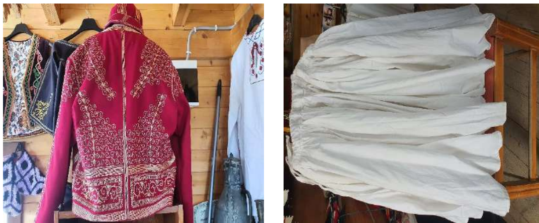
Fig. - 22 Fustanella e Labërisë