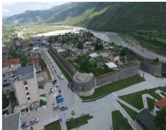
Fig. - 24 Kalaja e Tepelenës 2021