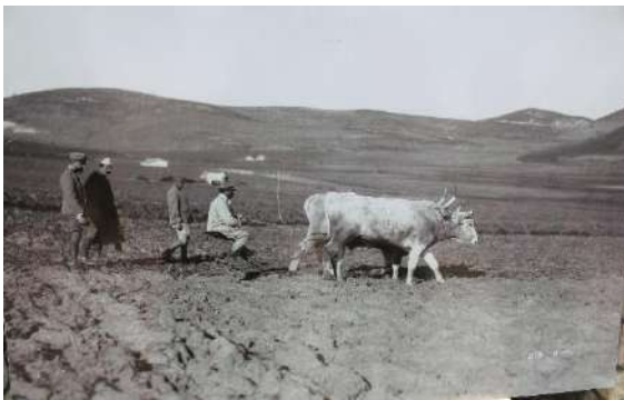
Punimi i Tokës me parmëndë me qe