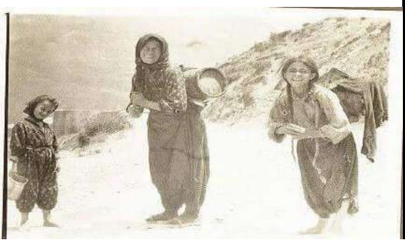
Mbushja ujë me bucela për dasëm Tepelenë 1927 me këngë labe