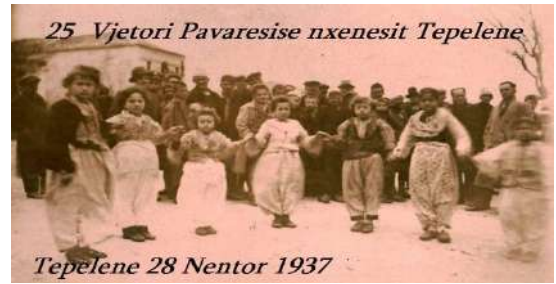
Valle me nxënësit Tepelenë 28 Nëntor 1937 25 Vjetori Pamvarësisë