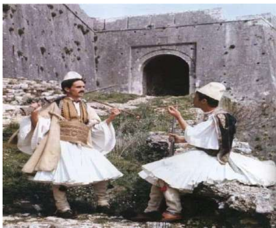
Fig. - 23 Kalaja e Ali Pash Tepelenës 1819