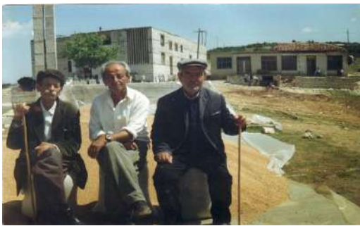
Rituali bereqetit ,gruri në lëmin e tij