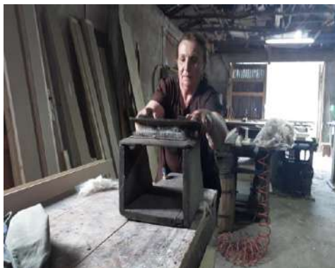
Fig. – 17 Krehja e leshit ne Llanar