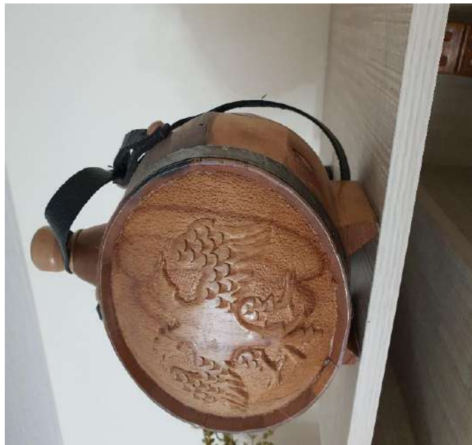
Fig. - 32 Paguri i ujit apo i rakisë së bariut