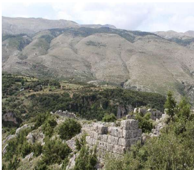
Fig. - 27 Kalaja e Matohasane Lops