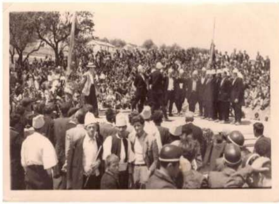
FESTIVALI FOLKLORIK I RRETHIT MAJ 1958 GRUPI VALLES SE BURRAVE KURVELESH