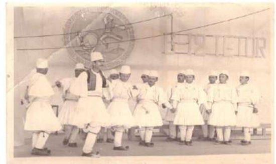
Valle e burrave të Kurveleshit 1973