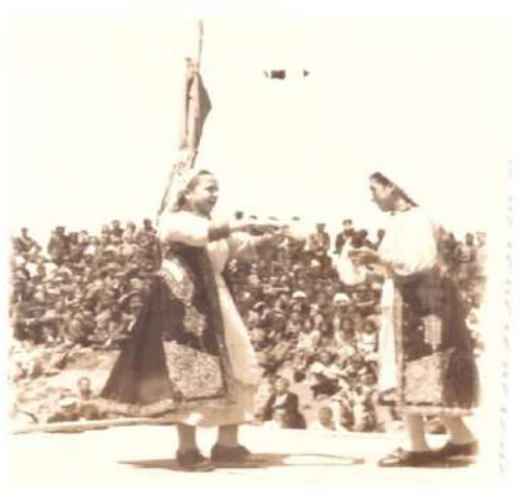
Valle dyshe Grash të Labërisë