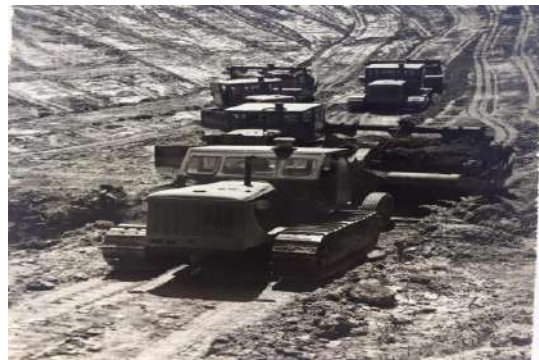
Punimi me Traktor