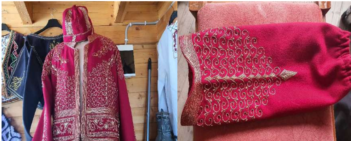
Fig. - 21 Motive të veshjes së Ali Pashës në takimim me Poetin Lord Bajron