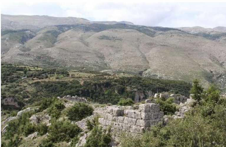
Fig. - 3 Krahu lindor i Kalas Matohasanaj Lops.

Në drejtim të perëndimit dhe të lindjes muri antik vazhdohet nga mure të periudhave të mëvonshme si antikiteti i vonë dhe periudha otomane . Muret e ndërtuara në