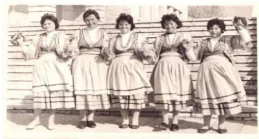
Të rejat e Lekdushit 1967 Tepelenë