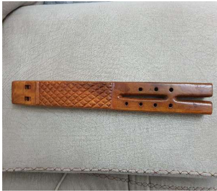
Fig. – 31 Cyla dyjare e bariut