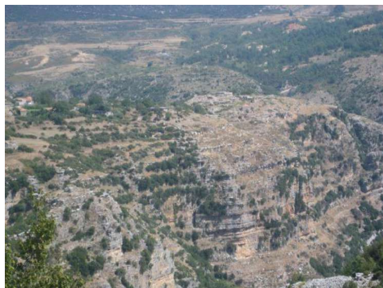
Fig. - 26 Kalaja e Nivicës Kurvelesh