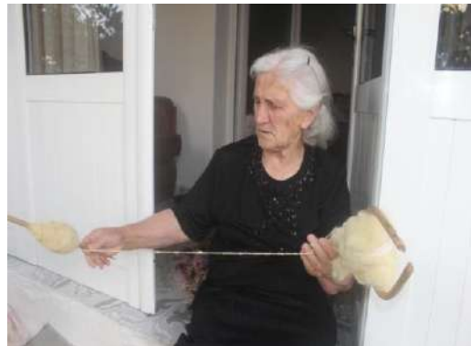
Fig. – 18 Tjerrja e leshit në Furk