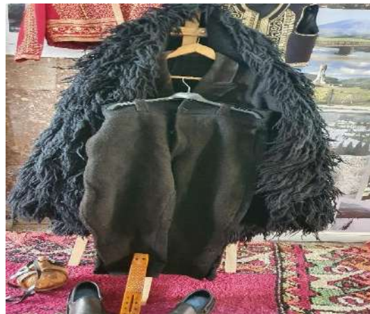
Fig. – 16 Poturet e Bariut & Opingat e Bariut