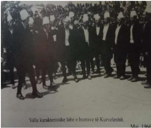
Festivali Folklorik i rrethit Tepelenë 1959