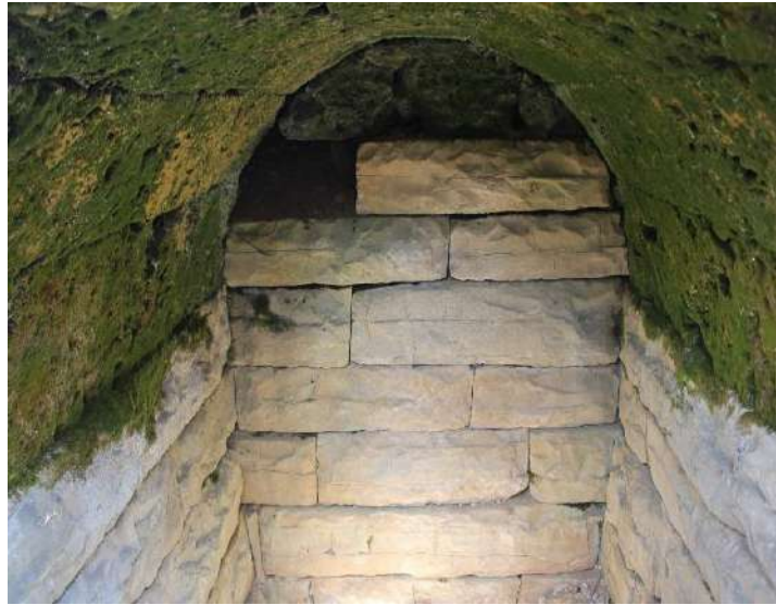
Fig. - 28 Varr monumental në Kalanë Matohasanaj Lops

Do të ketë veshjet e vjetra të Bariut të punuara me dorë dhe në ndërstil nga Artizanë të vjetër si: Sharku i bariut palltua e leshtë e bariut, poturet e leshta të bariut, qylau dhe opingat e bariut.