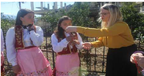
Rituali i ditës së Verës

Rituali i djepit, mbushja ujë me bucela për dasëm, rituali i dasmës, të korrave të bereqetit, të qethjes së bagëtive, të Ditës së Verës, ceremonialet fetare. Këtu hynë dhe larmia e lodrave popullore për fëmijë e të rinj.