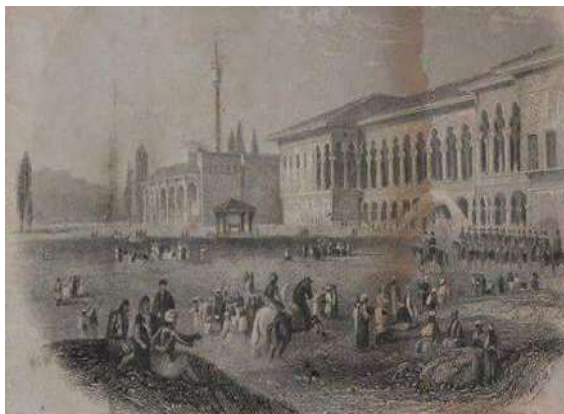
Fig. - 11 Vizita e Lord Bajron më 21 tetor 1809

Brenda kalasë kanë qenë Sarajet e mëdha të pashait, ndërtesat e garnizonit dhe gjithë infrastruktura e nevojshme e mbrojtjes së kalasë.