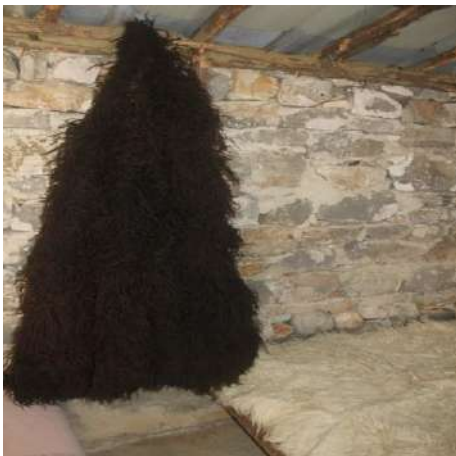
Fig. – 15 Sharku i Bariut

Punimet e mjeshtrave për bërjen e instrumenteve popullore si : cula dyjare, zbukurimi tavaneve të dhomave, musendart (dollapë për rroba e enë) zbukurimi dhe punimi i djepeve, kërrabë çobani, etj.