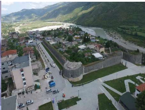
Fig. – 7 Porta veriperëndimore – porta kryesore e fortifikimit