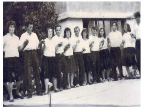
Valle dyshe e Grave dhe burrave të Dukaj 1968