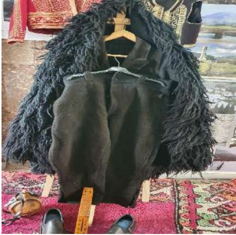
Fig. - 29 Veshja dimërore e bariut ujit

Do të ketë veshjet e vjetra të Bariut të punuara me dorë dhe në ndërstil nga Artizanë të vjetër si: Sharku i bariut palltua e leshtë e bariut, poturet e leshta të bariut, qylau dhe opingat e bariut.