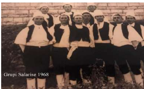
Grupi Polifonik Salari 1968