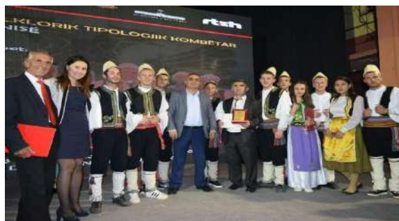
Grupi Polifonik “Vatra Labe ” në Vlorë fitues të cmimit Maliq Lila