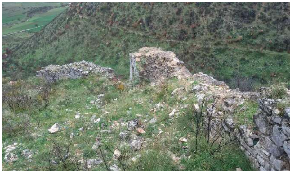
Fig. - 5 Kalaja e Zharrës

Vendbanime të fortifikuara me mure masive në Zharrë, Horë, Rabie, Lekël etj.