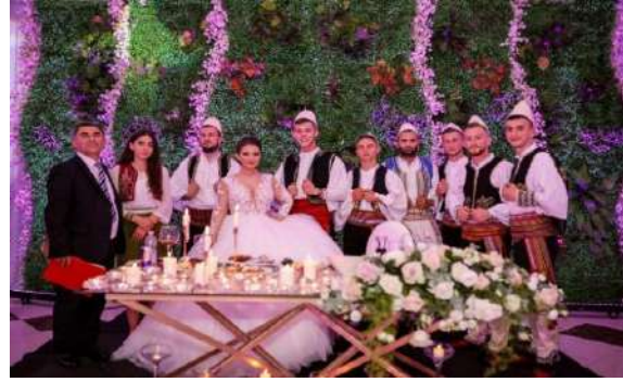
Dasmat e Sotme, pritja e nuses