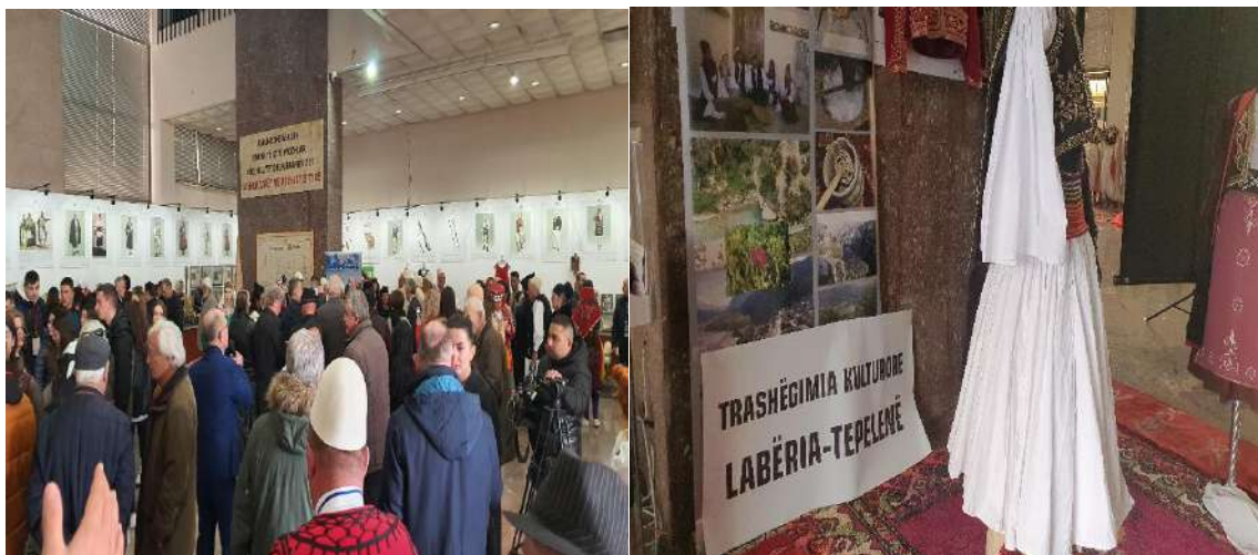
Fig. - 20 Kuvendi i IV i Akademisë “Rrënjët tonë ” 2 deri më 4 mars 2022