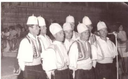
Grupi Polifonik Dukaj 1973