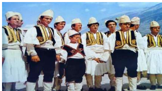
Grupi Polifonik Salari 1978