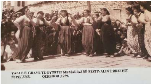
Valle e grave Memaliaj qershor 1959 Në festivalin e rrethit Tepelenë