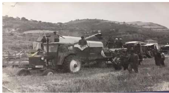
Korrja e grurit