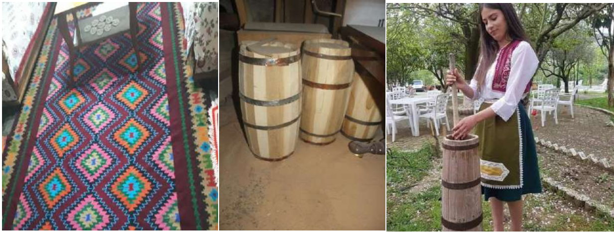
Fig. – 14 Qylym leshi i punuar në tezgja, Voza ku mbahet djathi dhe Dybeku ku rrihet kosi bëhet dhallë