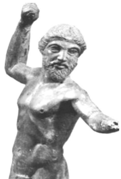
Fig. - 3 Dia i Dodonës me qeleshe

Planche nr XII (Përshkrimi i statujës nga M. le Baron de Witte) Planche XII, nr. 4. (Përshkrimi i statujës nga M. le Baron de Witte) Zeusi plotësisht lakuriq, duke mbajtur rrufenë në dorën e djathtë dhe duke shtrirë krahun e majtë. L'archaïsme de ce bronze n'est qu'afecte et apparent. Imitimi në këtë mënyrë i shekujve të mëparshëm në këtë staujz është jo i natyrshëm dhe i sipërfaqshëm. Realisht i përket një epoke ku kërkohet të imitoheshin format e artit primitiv, ndoshta i përket shekullit të tretë ose të dytë para Krishtit. (Lartësia 11 cm 13).