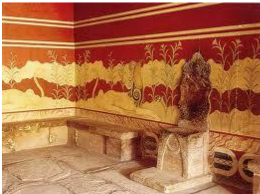
Froni i Mbretit të Mikenës në qytetin Minosse,