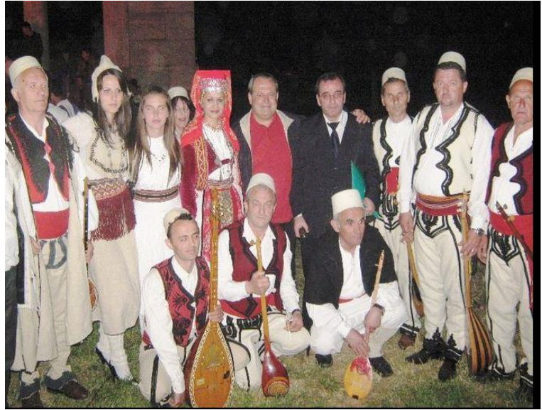
Fig. – I Veshje popullore të Mirditës

Në veshjet për gra, më i përhapuri ishte tipi me këmishë të gjatë e një përparje (që plotësohej me një xhokë leshi për stinën e ftohtë) dhe që shfaqet me variante të shumta e të pasura zonale. Interes të veçantë për origjinalitetin e saj të theksuar paraqet