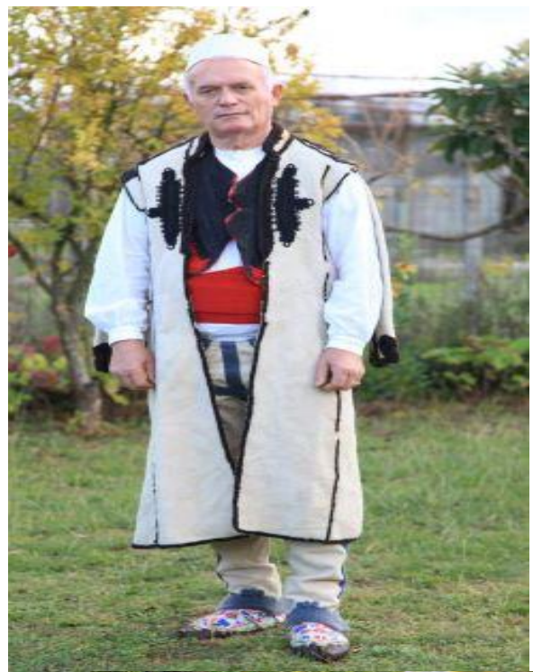
Fig.- 2 Kostumi i burrit mirditor

Veshjet mirditore janë me elemente të pastra shqiptare, pa ndikime osmane dhe sllave. Kostumi i burrave të Mirditës ndryshon pak nga ai i trevave fqinje. Veshja e vjetër ishte ajo me brekesha e këmishën përmbi to dhe pastaj dollamën prej shajaku të bardhë, të qepur e të zbukuar hijshëm me gajtana të