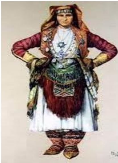
Fig. - 3 Kostumi mirditor(nusja dhe dhëndrri)

Shkenca antropologjike i konsideron të lashta këmishat e gjata e të shkurtëra, për burra e për gra, që në kulturën ilire njihet me emrin dalmatika ilire, ose pjesët kostumore që zbukurohen me thekë e me tufa, siç është rasti me përparset e grave etj. 19 Veshja popullore e grave të Mirditës i përket një tipi veshje për gra, shumë të përhapur në vendin tonë dhe në vise të tjera të Ballkanit, si veshje me këmishë të gjatë dhe përparse. Pjesë kryesore e kësaj veshje është këmisha e gjatë, me mëngë të gjata, të gjëra ose të ngushta. Në mes ajo shtërngohej nga një brez leshi me ngjyra të ndryshme dhe shoqërohej në pjesën e përparme nga një përparse e leshtë ose e pambuktë, me madhësi e zbukurime që ndryshonin nga njëra krahinë në tjetrën. Në stinën e verës, në pjesën e sipërme, gruaja e veshur me këtë këmishë mbante një jelek, kurse në dimër sipër tij shtonte edhe një xhokë prej shajaku.