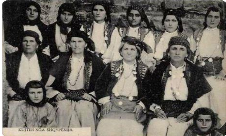
Fig. - 5 Veshje të femrave mirditore të moshave të ndryshme.

Vathët prej argjendi të grave të Mirditës ngjajnë me gjetjet arkeologjike të Komanit, Buklit dhe Krujës të shekujve VI-VIII. 28 Në vitin 1919, Artur Haberlandi