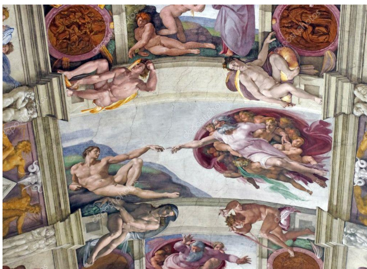
Fig. – 1 Krijimi i Adamit, pikturë e Mikelanxhelos (TheSistine Chapel Ceiling, 1512)