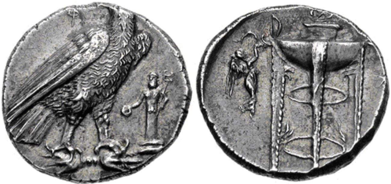
Fig. – 2 Monedha e porositur nga Pirro Burri me rastin e fitores në luftë, me simbolin e përfaqësueses së Zotit - Shqiponjën dhe Hermesin pellazg (perëndin hënore Thot të Egjiptit të lashtë). Në anën tjetër, kupa e shenjtë mbi trekëndëshinkultik, simbol i besimit hënor dodonas.