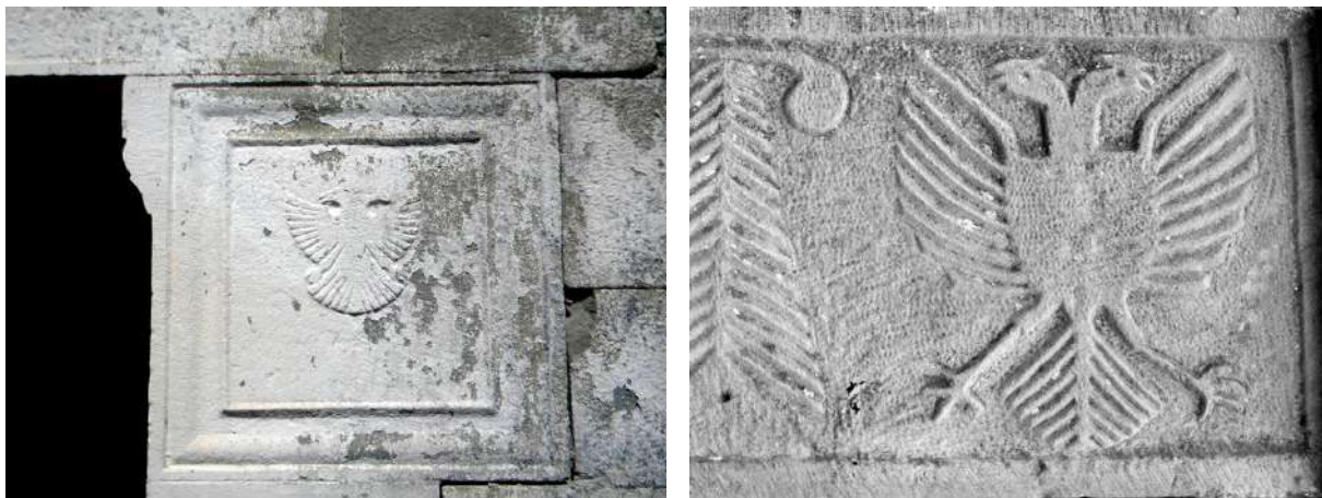
Fig. – 9, 10 Motivi i shqiponjës pa yll - Fshati Burrel dhe Karicë

rasteve shqiponjën e gjejmë pa yll sipër edhe pse (nisur nga datimet) këto janë realizuar në vitet 50-60 deri fillimvitet '70 të shek. XX, kur ylli ishte në flamurin kombëtar, sipër shqiponjës. Shqiponjën e hasim dendësisht edhe në ballet e oxhakëve. Oxhaku ose vatra e zjarrit, që në kuptimin figurativ personifikon vatrën familjare, ishte vendi ku mblidheshin rreth tij familjarët për t'u ngrohur, gatuar, për të pritur mikun dhe pjekur kafen.