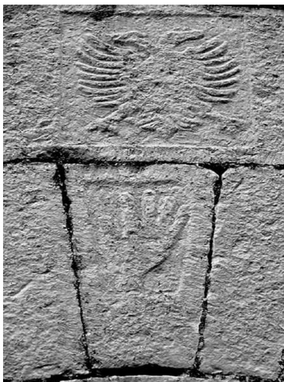
Fig. - 18 Motive të mikpritjes. Fshati Dukagjin (Mat)

që kërkon strehë në atë banesë. Por dora është aty edhe si simbol i pronësisë së banesës. Etnologë të ndryshëm kanë publikuar ilustrime të gdhendjeve të një dore në funksion të mesazhit të përfaqësimit të besës që afrojnë banorët e asaj banese, si dhe dy duarve të lidhura, duke uruar mirëseardhjen dhe bujarinë. Në portat e shtëpive në qytete “takllima” ishte një objekt në formën e një dore metalike me të cilën trokiste i ardhuri. Gjatë gjurmimeve në terren kemi mundur të fotografojmë raste të përdorimit të motivit të dorës si dekoracion dhe me qëllim funksional. Në Fushë-Baz të fshatit Baz, në banesën e Kolë Gjetë Gjinit, në fasadën e së cilës ndodhen dy porta hyrëse, kemi fotografuar dy duar të shtrëngyara, të gdhendura në relief mbi njërin nga portat.