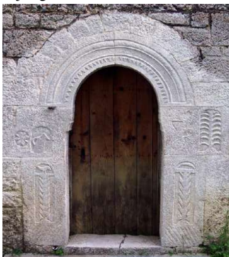
Fig. - 4 Dera hyrëse e një banese me mbishkrim dhe motive të ndryshme. Fshati Shulbatër

Në shumë raste, ndërthurur me elementët e sipërpërmendur, hasim simbole religjioni, si kryqin dhe hënë me yll, elemente paganë diellin, pemën e jetës, të cilët i gjejmë kryesisht në ballet e oxhakëve dhe dyert e avllive dhe të banesës.(13) Shumica e mjeshtrave që kanë ushtruar zëjen e gdhendjeve në gur dhe dru të banesës matjane, janë vendas,(14) pasi Mati ka patur shkollën e vet të gdhendjes. Por, në mungesë të një qendre qytetare, ajo mbeti në shkallën e ushtrimit të një zeje fshatare(15) brenda ekonomisë familjare, fshatit apo krahinës. Ka edhe raste kur mjeshtrit ndërtues dhe gdhendës vinin nga Golloborda, Çermenika, Mirdita, ose ishin nga sllavët e Maqedonisë së Veriut. Ata sollën risi për sa i takon teknikave të ndërtimit, por iu kërkuar të përdorin si model në ndërtimet e reja banesën e tipit kullë. Në këtë mënyrë, edhe zbukurimorja e kullave ka shërbyer si shëmbëlltyrë dhe model për ndërtimet e reja nga koha në kohë.