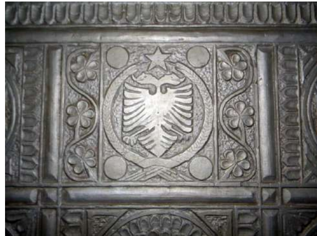
Fig. – 12, 13 Motivi i shqiponjës me yll. Fshati German dhe Shulbater

Kemi dhe raste kur motivi i shqiponjës, brenda stemës së republikës, është pranë simboleve të huaja siç është hëna me yllin-simbol vendeve islamike Përrjashtim nga shqiponjat me përmbajtje të ideologjisë komuniste është një oxhak në fshatin Bel të Klosit, ku shqiponjën e gjetëm të përfshirë në stemën e monarkisë shqiptare, ndërkohë që ndërtimi shënon vitin 1958 dhe një rast tjetër në fshatin Bushkash, ku përsëri ishte gdhendur stema e monarkisë shqiptare. Duke iu referuar kohës së ndërtimit të banesës, ky oxhak është realizuar gjatë viteve '70 të shek XX.