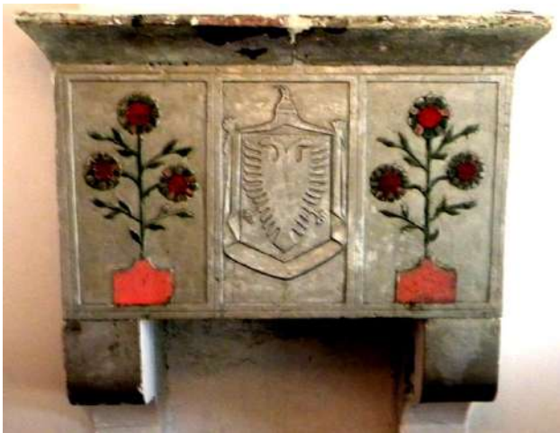
Fig. - 14 Motivi i shqiponjës në stemën e Monarkisë Shqiptare, fshati Bushkash

Kemi dhe raste kur motivi i shqiponjës, brenda stemës së republikës, është pranë simboleve të huaja siç është hëna me yllin-simbol vendeve islamike Përrjashtim nga shqiponjat me përmbajtje të ideologjisë komuniste është një oxhak në fshatin Bel të Klosit, ku shqiponjën e gjetëm të përfshirë në stemën e monarkisë shqiptare, ndërkohë që ndërtimi shënon vitin 1958 dhe një rast tjetër në fshatin Bushkash, ku përsëri ishte gdhendur stema e monarkisë shqiptare. Duke iu referuar kohës së ndërtimit të banesës, ky oxhak është realizuar gjatë viteve '70 të shek XX.