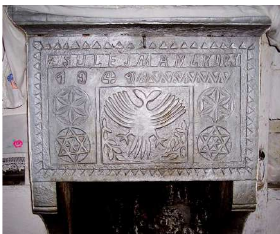
Fig. - 11 Motivi i shqiponjës në ballin e oxhakit të banesës së Sulë Likursit - Fshati Gurrë e Madhe.

Ai vendosej në një nga muret perimetrale të banesës për arsye konstruktive e funksionale të daljes së tymit dhe në pjesën më të dukshme të “Odës së burrave”, që ndryshe quhej dhe “Oda e miqve”. Kjo odë ishte krenaria e mikpritjes, prandaj duhej të kishte ngarkesë figurative në orenditë e pakta prej druri dhe në ballet e oxhakëve. Oxhaku, ku janë aplikuar dekoracionet popullore, është quajtur model frëng , në kuptimin model i ardhur nga kultura europiane. Elementët e tij, kryesisht, gdhendeshin në gur shtufi, që është material që nuk thyhet nga zjarri dhe i butë për tu punuar. Kështu, edhe ngarkesa dekorative e kompozicionale dhe cilësia e gdhendjes së motiveve janë shpeshherë më të saktë se ato të përdorura në portën hyrëse të banesës, ku janë përdorur gurë gëlqerorë apo mermer i kuq. Historia e zhvillimit të dekoracioneve të ballit të oxhakit është e njëjtë me atë të shqiponjës së punuar në hyrjen e banesës popullore të Matit, në vitet 20-30 të shekullit XX.(24)