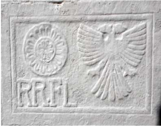
Fig. - 7 Motivi i shqiponjës në dollapët anës oxhakut - Fshati Shulbatër.

Duke u nisur nga mbishkrimet dhe duke e marrë të mirëqenë se datimet e gdhendura aty përputhen me kohën e ndërtimit të banesës, motivin e shqiponjës në banesën popullore të krahinës së Matit e hasim në fillim të shek. XX. Atë e gjejmë krahas ornamentikës dekorative dhe simbolike me përmbajtje pagane apo të religjioneve. Po t'i referohemi kohës para Rilindjes, motivi i shqiponjës është ruajtur në veshjen e gruas, siç është motivi i gunës,(18) por në gdhendjet dekorative të banesës ato rivijnë në dhjetëvjeçarin e dytë të shek. XX, kur u çelën edhe shkollat e para shqipe në krahinën e Matit. Nga kjo kohë mbishkrimet filluan të shkruhen në shqip dhe krahas elementëve të trashëguar të ornamentikës floreale dhe zoomorfe, simboleve të religjioneve; si gjysëm hëna me yll, kryqi etj, fillon të gdhendet simboli kombëtar: shqiponja dykrenare. Si element i heraldikës ajo është provuar nga studjes të ndryshëm që është shumë e hershme në trojet shqiptare.