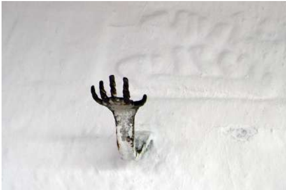
Fig. - 19 Motive të mikpritjes. Fshati Frankt

Fasada e saj me strukturë druri përfshin gjithë lartësinë në formë ballkonesh nga kati i parë deri tek i treti, të cilët shërbejnë edhe për ngjitje me shkallë druri. Në anën e majtë të portës së katit të tretë, ndeshëm një dorë në miniaturë të punuar në hekur të rrahur nga kovaçi, që luante rolin e gremçit ku vareshin rroba, shkopa apo armët e mikut. Gishtat e hapur dhe të përthyer lart