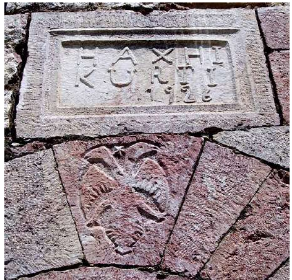
Fig. - 8 Motivi i shqiponjës në derën hyrëse të banesës së vëllazërisë Sulkurti. Fshati Prëll.

Këtu paraqitet shqiponja dykrenare me krahë të hapur me pendët poshtë, si shqiponja në stemën e Kastriotëve dhe vulën e Skënderbeut dhe nuk i ngjan shqiponjës së flamurit kombëtar të ngritur në Vlorë, katërmëdhjetë vite para së të ndërtohej kulla. Është për t'u hulumtuar më tej në se ky motiv është gdhendur njëkohësisht me ndërtimin e banesës, apo gurët janë huazuar nga ndonjë ndërtim i mëparshëm. Fakti që në mes dy kokave të shqiponjës ndodhet një yll pesëcepësh dhe jo gjashtëcepësh, përsëri shtyn për të studiuar zhvillimin historik të këtij simboli.