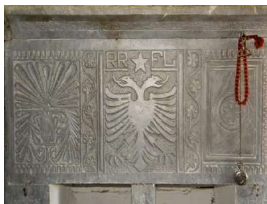
Fig. – 5, 6 Motivi i shqiponjës në derën hyrëse të banesës - Fshati Karicë dhe Zenisht Megjithëse në krahinën e Matit ka gjurmë të ekzistencës së banesës tip-kullë qysh në shek. XVI(17) dhe janë ende funksionale kulla të ndërtuara në gjysmën e dytë të shekullit XIX.